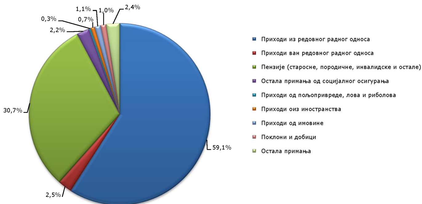
Гафикон 1. ПРИХОДИ ДОМАЋИНСТВА У НОВЦУ (СТРУКТУРА)